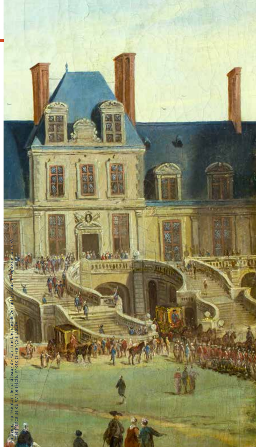
Paravent représentant les châteaux de Fontainebleau et de Versailles sous le règne de Louis XV, école française du XVIIIe siècle.

ungestehistorique.chateaufontainebleau.fr